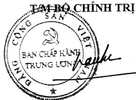
Trần Cẩm Tú